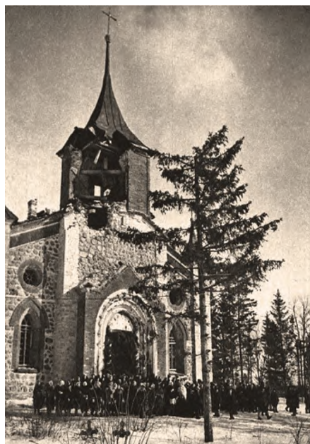
Повреждённая кирха Святого Иоанна Крестителя в Губаницах