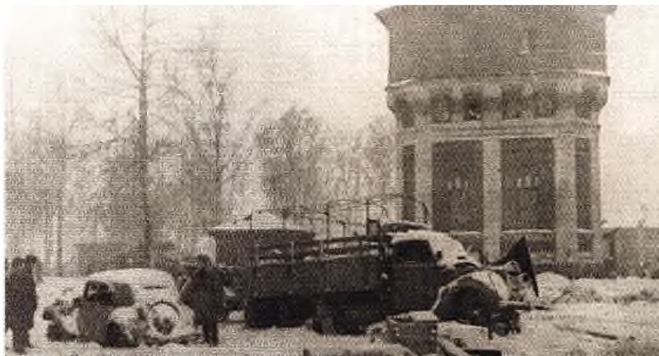
Захваченные на станции Волосово немецкие автомашины. 11 февраля 1944 г.