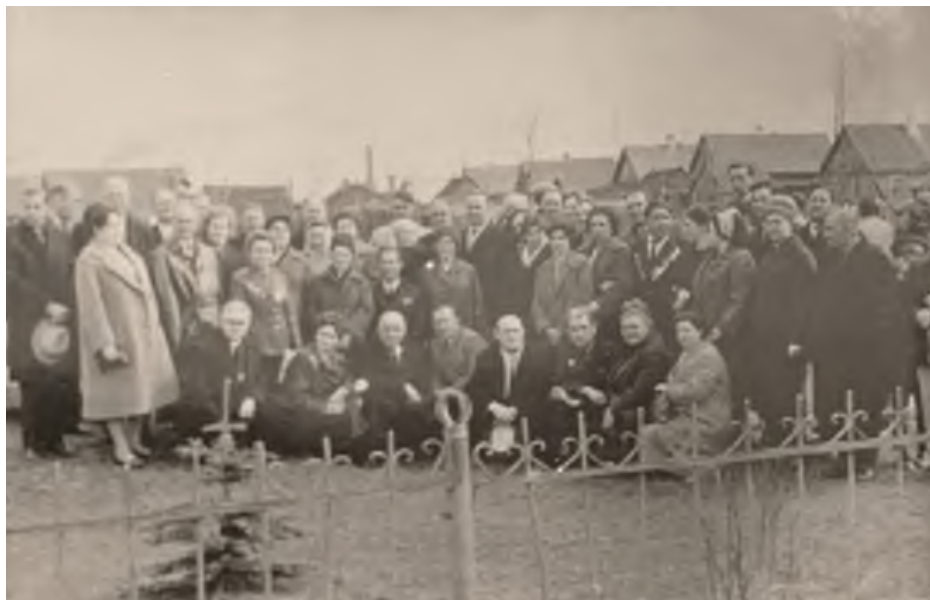
Ветераны 30-й гвардейской танковой бригады у братского захоронения в г. Волосово. 9 мая 1966 г.