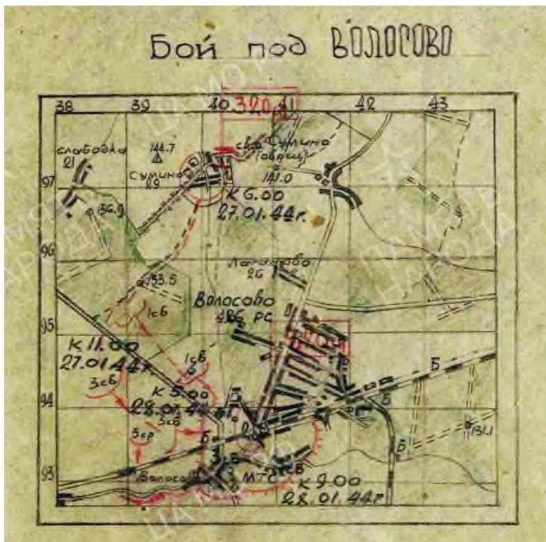
Схема боя за Волосово 27 января 1944 г. из Журнала боевых действий 320-го стрелкового полка.