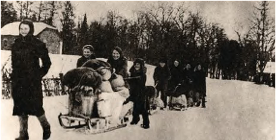
Жители села Торосово возвращаются домой после освобождения района от немецкой оккупации. Волосовский район, Ленинградская область, 1944 год.