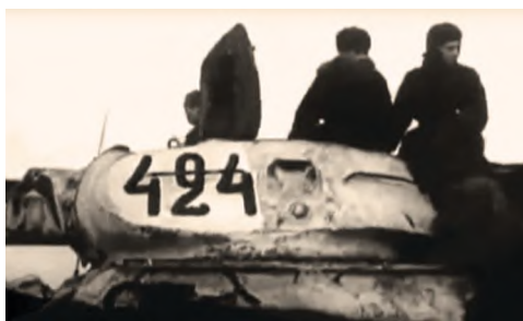
Фрагмент Союзкиножурнала № 10, февраль 1944 года: прохождение танковой колонны по дорогам Ленинградской области. Номера на броне позволяют предположить, что на кадрах кинохроники запечатлены танкисты 30-й гвардейской отдельной танковой бригады