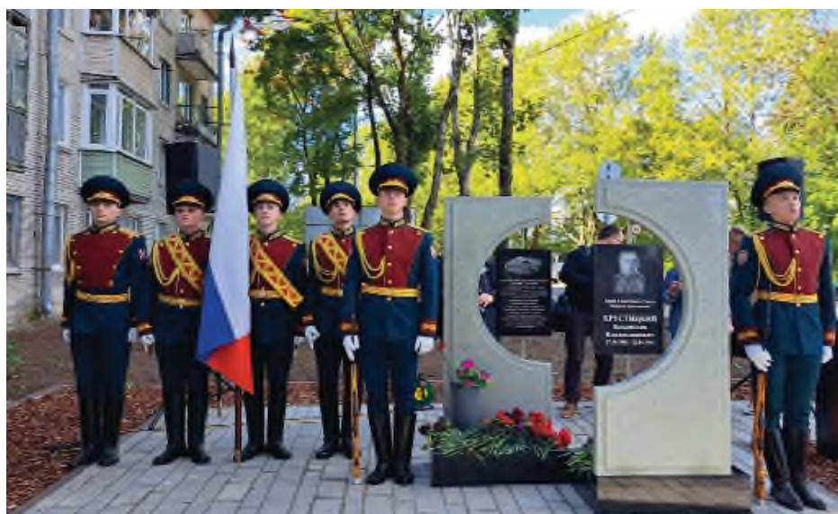
Открытие Памятного знака В.В. Хрустицкому в г. Волосово в сентябре 2023 г.