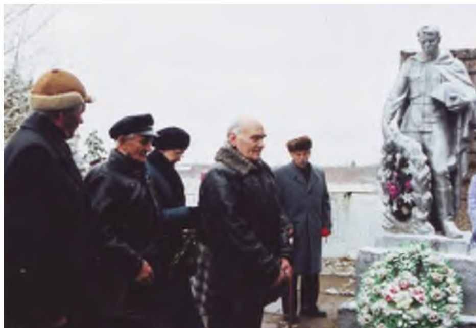
Выезд в д. Губаницы на место боя и гибели командира бригады. Ветераны у братского захоронения в д. Губаницы.