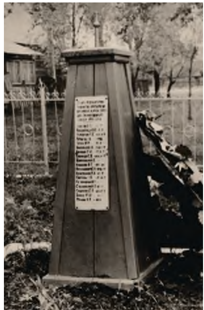
Братская могила танкистов 30-й гвардейской танковой бригады, погибших в бою 27 января 1944 г. Список на памятнике соответствует списку братской могилы №1 (100 м. южнее здания жд станции Волосово). Август 1978 г.